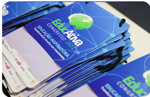
PÓRTICO DE ENTRADA E CREDENCIAMENTO