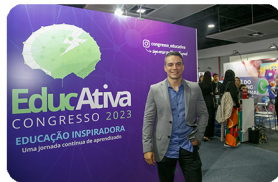
AREA DE FOTOS